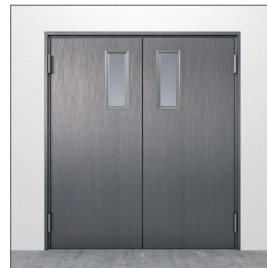
Glasurtag: GU3 150x600 mm