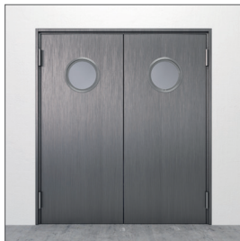
Glasurtag: GU1 D=300 mm