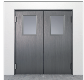
Glasurtag: GU4 400x600 mm

Mått avser fritt ljusmått. Andra storlekar mot förfrågan. Dörrarna levereras glasade från fabrik. Som standard tillverkas glaslisten av rostfri slipad plåt och målas ej. Målad glaslist är tillval.