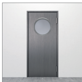
Glasurtag: GU2 D=490 mm