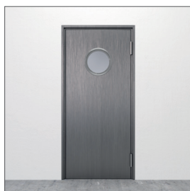
Glasurtag: GU1 D=300 mm