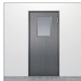
Glasurtag: GU4 400x600 mm

Mått avser fritt ljusmått. Andra storlekar mot förfrågan. Dörrarna levereras glasade från fabrik. Som standard tillverkas glaslisten av rostfri slipad plåt och målas ej. Målad glaslist är tillval.