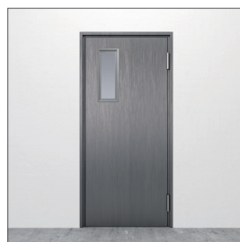
Glasurtag: GU3 150x600 mm